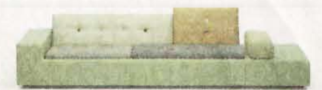
Eine Farbe alleine ist einsam. Das Sofa „Polder“ (oben) oszilliert in Grün. Was man nicht sieht: In Jongerius' Atelier ist auch der Tee grün (links).